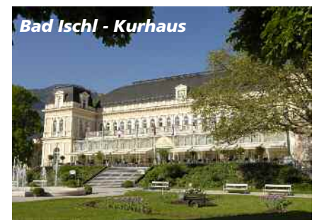
Bad Ischl - Kurhaus

gen wurden bei Kriegsende im See versenkt. Im April 1945 wurden zudem ungezählte Kisten zum Toplitzsee transportiert. Seitdem vermutet man dort u.a. 50 Kisten Gold und Feingold, 5 Kisten mit Brillanten, Beutegut aus Ungarn, den Tatarenschatz sowie 20 Kisten Goldmünzen aus aller Welt. Die Suche danach wird allerdings strengstens reglementiert.