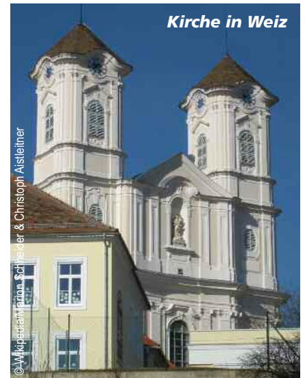
Kirche in Weiz

beliebtes Sommer- wie Winter-Urlaubsdomizil der sogenannten „feinen Gesellschaft“ Wiens. In den oftmals mondänen, aber auch höchst sehenswerten Villen des Kurortes gastierten nicht nur Habsburger Kaiser, sondern auch Poeten, Schriftsteller und berühmte Musiker. Einer der Gründe war sicherlich der Bau der Ei-