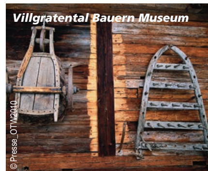
Villgratental Bauern Museum

überlieferter Prangersäule im oberen Teil des Marktplatzes, übrigens der einzigen aus dem Mittelalter erhaltenen Prangersäule Tirols. Sie wird erstmals 1552 urkundlich erwähnt. Das einstige Gerichtsgebäude von Silian, in dem die oftmals todbringenden Urteile gefällt wurden, ist die heutige Apotheke gegenüber der Steinsäule.